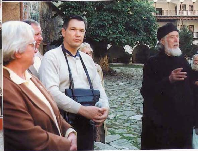
Malerisch gelegen, abseits des Verkehrs: das großartige Rila-Kloster. – Volkstänze, so brillant vorgetragen, waren eine erstaunliche Totlev. – Ein Hauch von Paris: „Folies Bergère“ auf bulgarisch ... die Lions aus dem District 111-MN waren angetan von der profes

bracht, die ihm den Zugang verwehrt: ein Hirschgeweih! Es soll dem Zweigehörnten schon gleich am Eingang klarmachen, daß er es hier mit noch mächtigeren Hörnern zu tun bekommt, falls er sich erdreisten sollte, einzudringen.